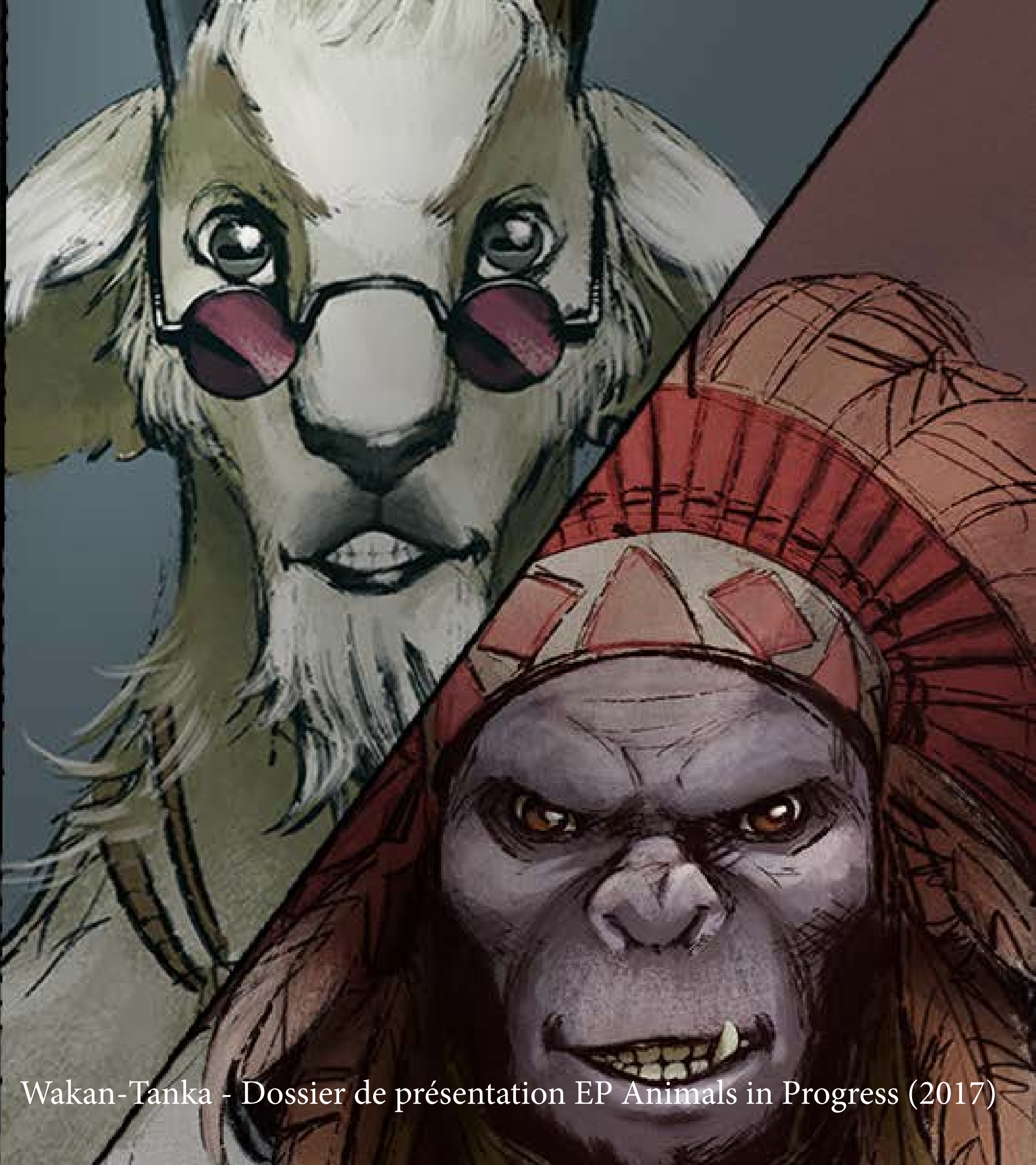
Wakan-Tanka - Dossier de présentation EP Animals in Progress (2017)